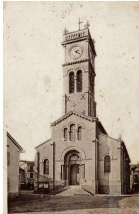
L'église actuelle vers 1930