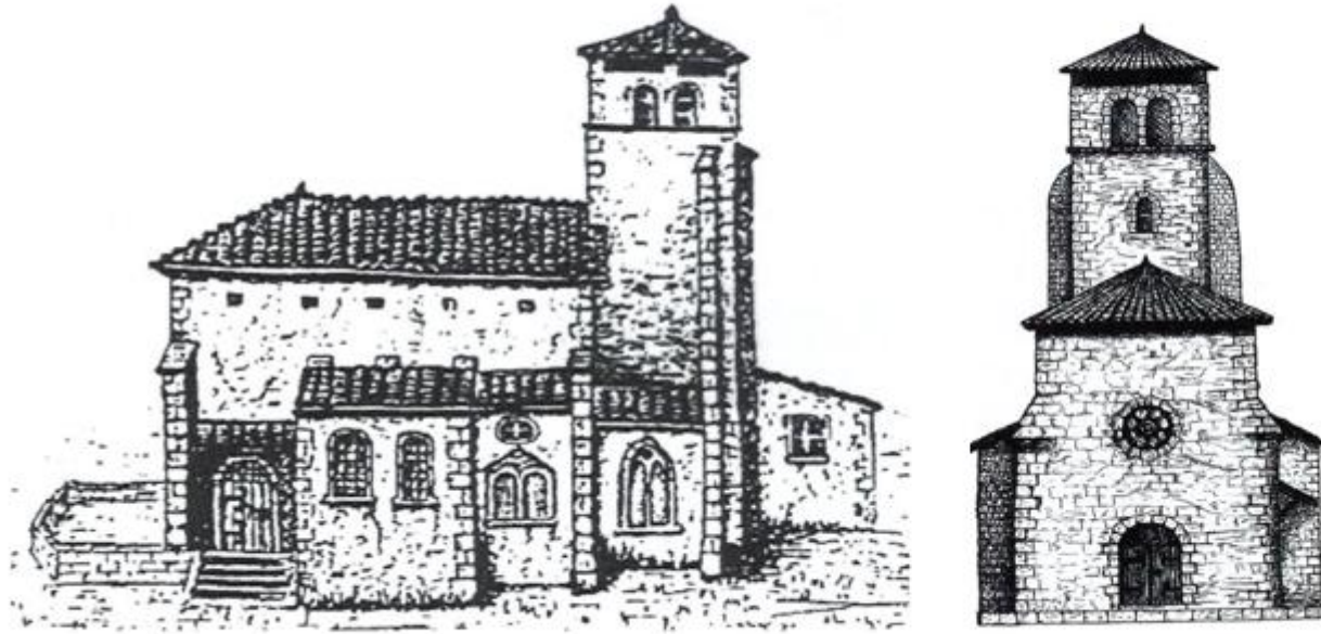
Elévations facades sud et ouest de la deuxième église du XIème siècle