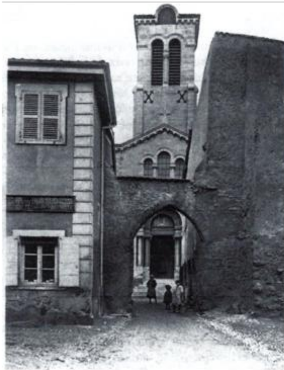
L'église actuelle vers 1900