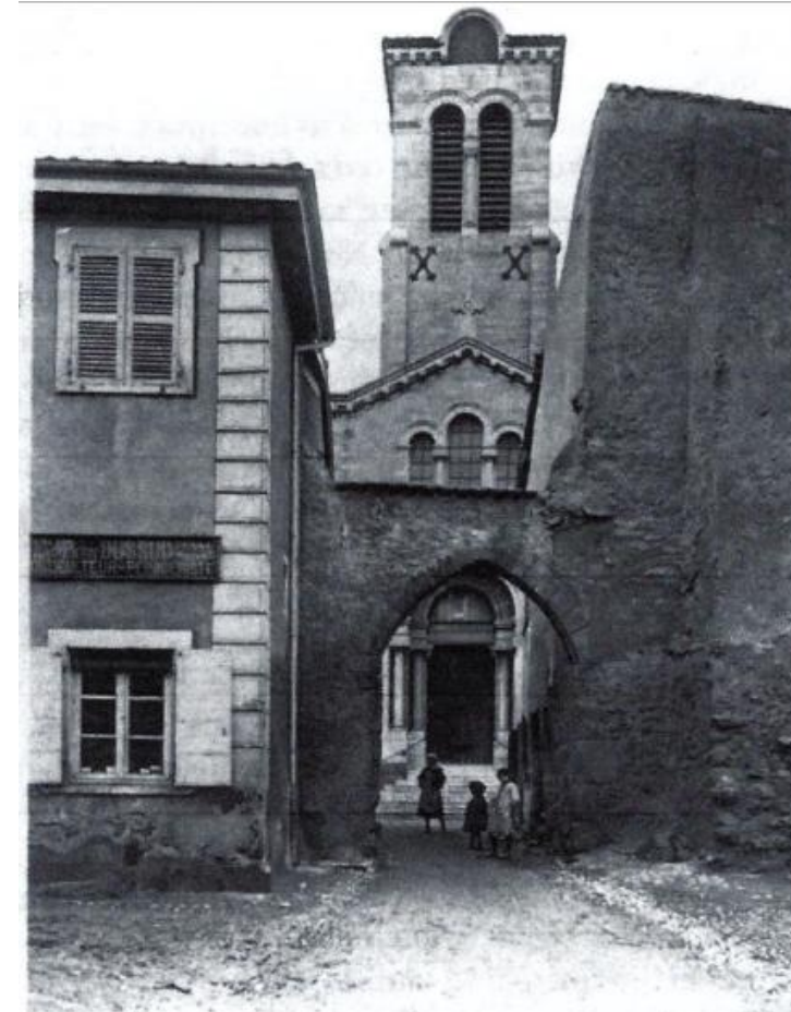
L'église actuelle vers 1900

Pour en savoir plus, flashez ce QR code ou rendez-vous sur glvpatrimoine.fr