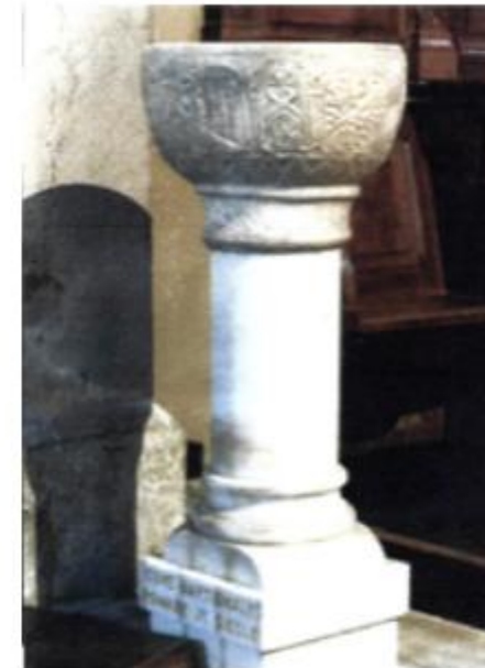
Bénitier du XIème siècle

Pour en savoir plus, flashez ce QR code ou rendez-vous sur glvpatrimoine.fr