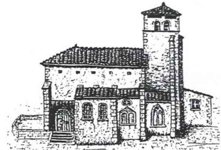
Elévations façades sud et ouest de la deuxième église du XI ème siècle

L'église présente des vitraux remarquables fabriqués principalement entre 1880 et 1902 par Lucien Bégule maître verrier lyonnais et Lorin de Chartres et surtout un bénitier (classé aux monuments historiques depuis 1963), daté du XI ème siècle, d'origine inconnue et d'une telle valeur qu'à l'époque le village ne pouvait réunir assez d'argent pour se l'offrir.