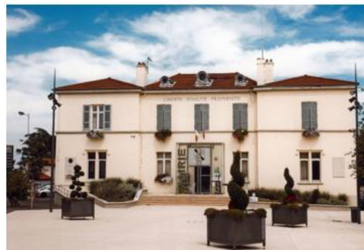
La mairie en 2025