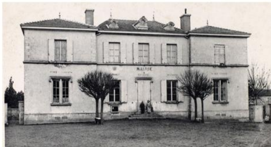
Le groupe mairie-écoles vers 1900